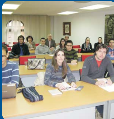
Participantes en Programa YUZZ junto a miembros de SECOT