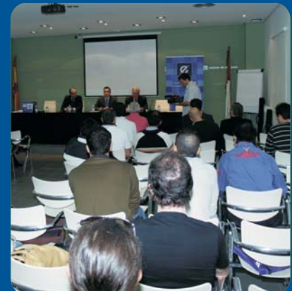
Curso Creación de Empresas en Alcázar