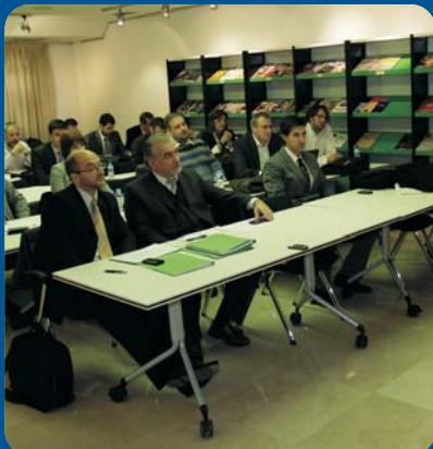
Jornada "Cooperar para Crecer"